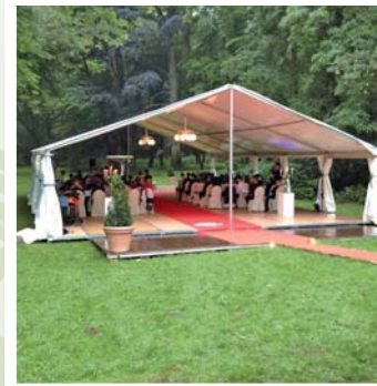
Kommunions- und Geburtstagsfeste, Taufen