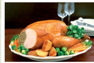
Weihnachtsfeiern mit Gänseessen