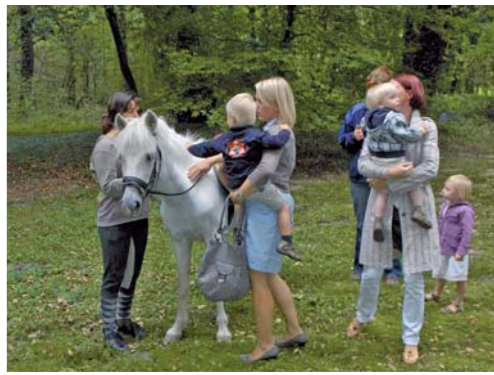
Rittergut Orr: naturnah und doch urban