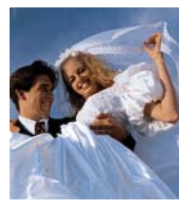
Hochzeiten mit Stil