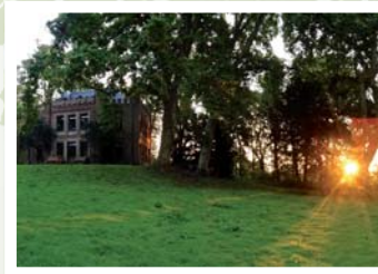
Sommerfeste für große und kleine Gäste