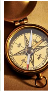
Geocaching in Kölner Norden