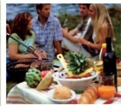
Sommer- party in schöner Natur